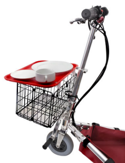
Kit viagem cruzeiro