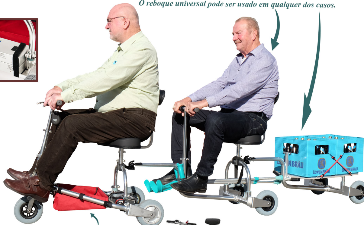
Para bagagem leve