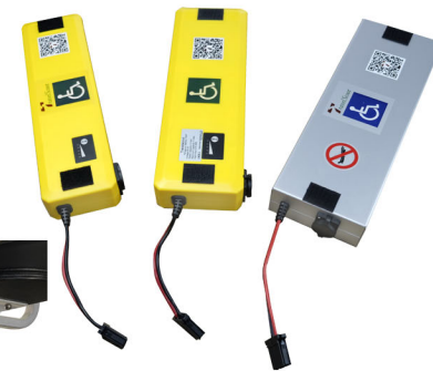
3x diferentes tipos de baterias lithium disponíveis