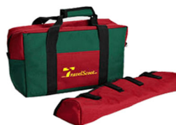
Kit viagem aérea