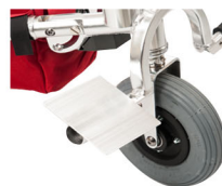
Placa de pés