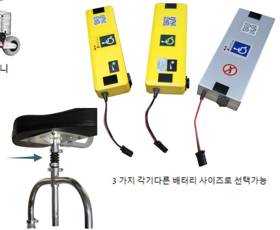
3 가지 각기다른 배터리 사이즈로 선택가능